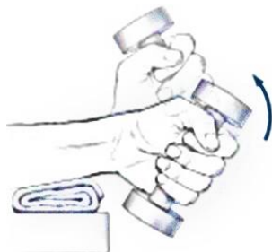
橈側屈肌肌力訓練